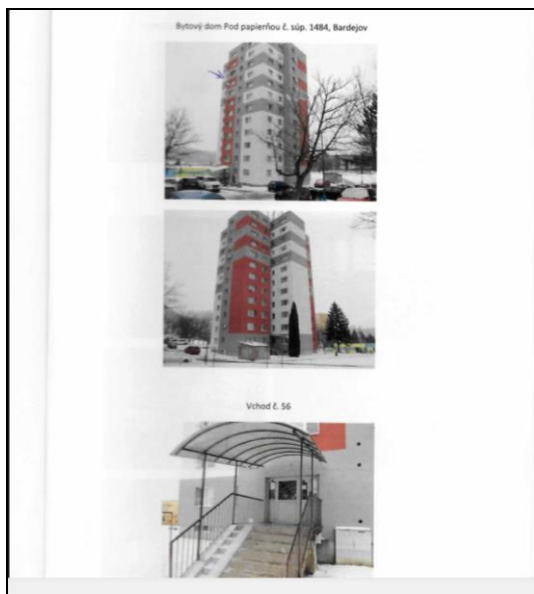
Bytový dom s.č. 1484