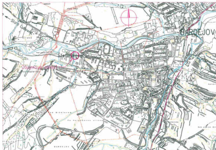
Celková situácia Mierka 1:20 000

NÁMRAZOVÁ OBLASŤ: I-1 (VN), LAHKÁ (NN) ZNEČISTENIE OBLASŤ: MALÉ - Z I.